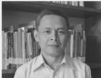
Kepala Perpustakaan IAIN Pontianak