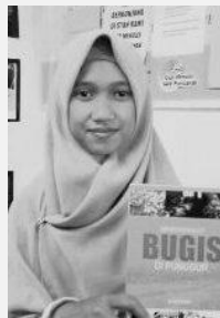
Saripaini Newsletter Crew

Newsletter: Memupuk Semangat dan Minat Belajar